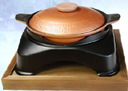
30cm鍋使用時 鍋がすっぽり入り、高さが低くなりますので 汁もの等にいかがでしょうか。